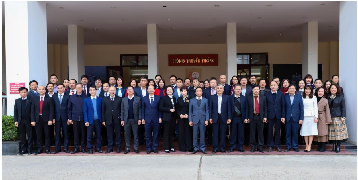
Các đại biểu chụp ảnh lưu niệm.