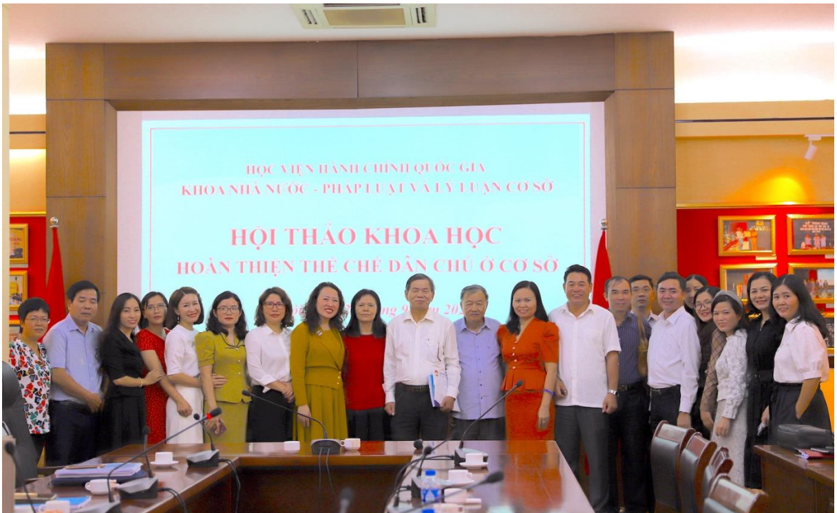
Các đại biểu dự Hội thảo chụp ảnh lưu niệm.