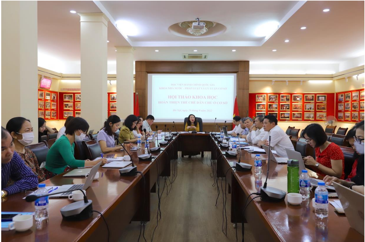
Toàn cảnh Hội thảo.