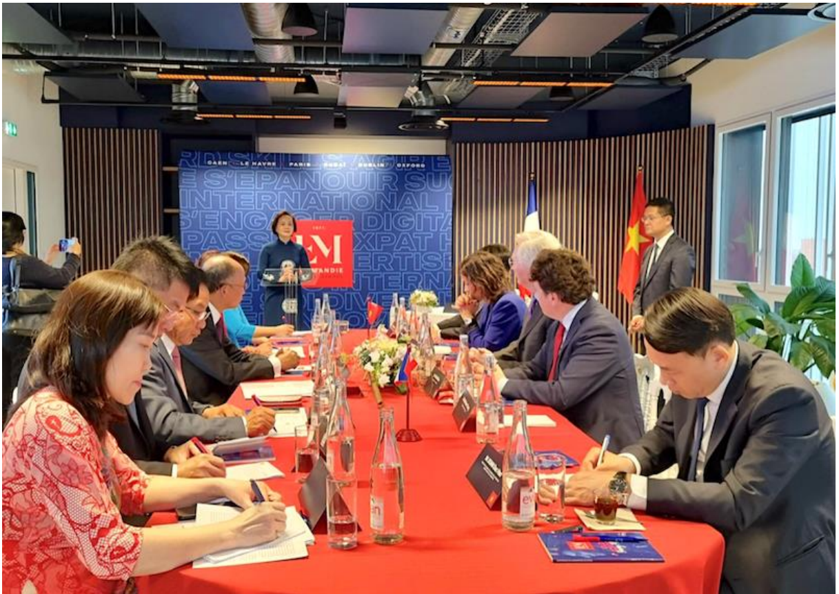
Bộ trưởng Bộ Nội vụ Phạm Thị Thanh Trà phát biểu tại buổi làm việc và Lễ Ký kết Thỏa thuận Hợp tác giữa Học viện Hành chính Quốc gia và Trường Quản trị Normandie.

nhà nước, các đơn vị sự nghiệp ở trung ương và địa phương; Hợp tác trong nghiên cứu khoa học, trao đổi giảng viên, sinh viên và viên chức quản lý.