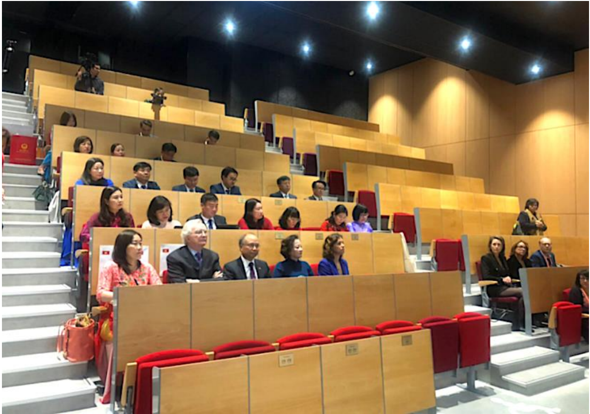
Quang cảnh Lễ khai giảng khóa bồi dưỡng quốc tế.