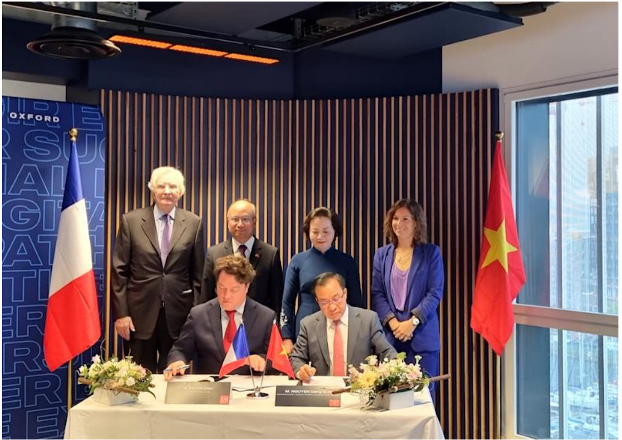
Lễ ký kết Thỏa thuận hợp tác giữa Học viện Hành chính Quốc gia Việt Nam và Trường Quản trị Normandie, Cộng hòa Pháp.