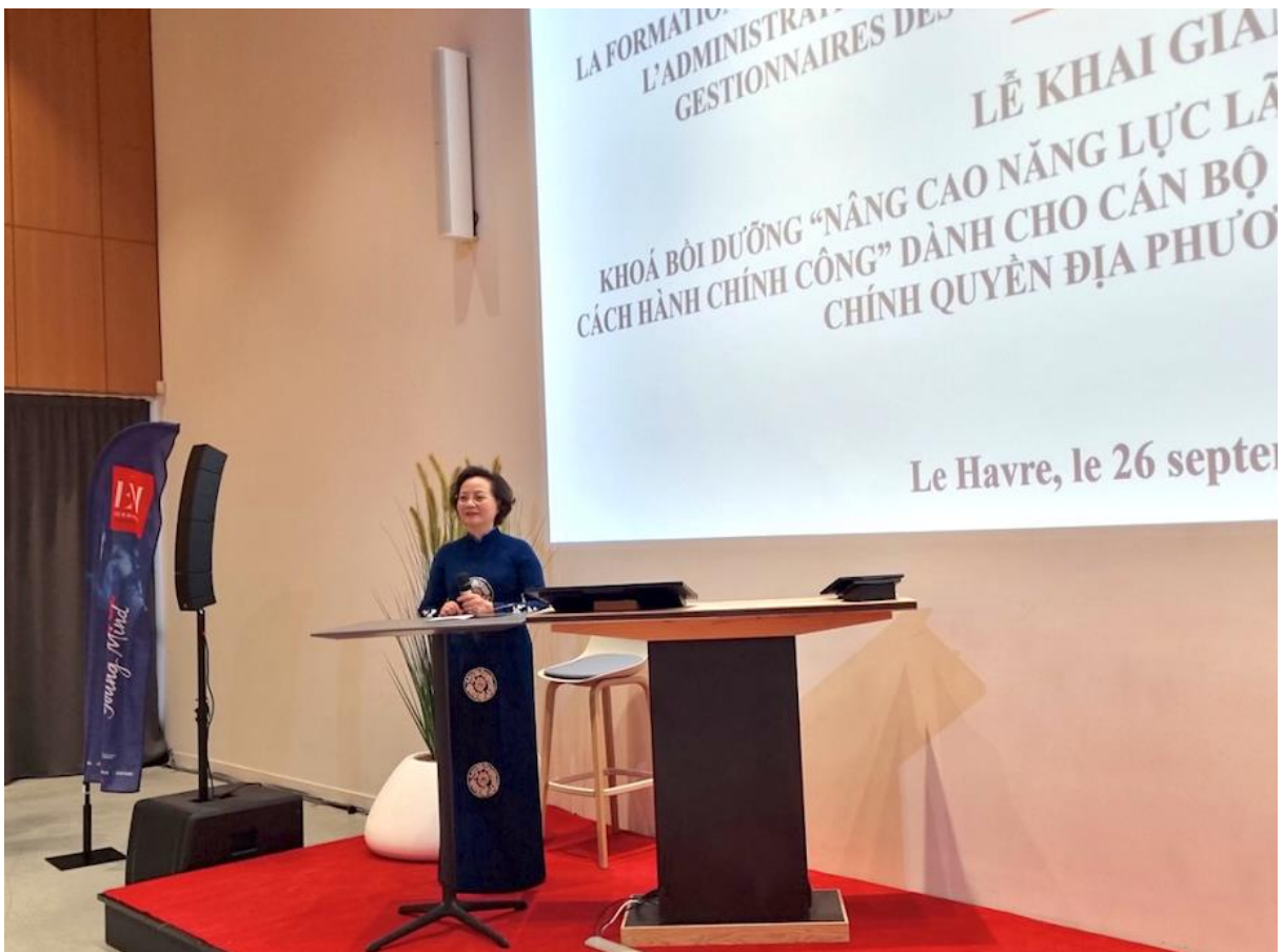
Bộ trưởng Bộ Nội vụ Phạm Thị Thanh Trà phát biểu tại Lễ Khai giảng khóa bồi dưỡng quốc tế dành cho cán bộ quản lý trẻ, cán bộ quản lý nữ chính quyền địa phương Việt Nam.

Tại Trường Quản trị Normandie, Bộ trưởng Phạm Thị Thanh Trà đã chủ trì và phát biểu tại Lễ khai giảng khóa bồi dưỡng quốc tế dành cho cán bộ quản lý trẻ, cán bộ quản lý nữ chính quyền địa phương Việt Nam về “Nâng cao năng lực lãnh đạo, chuyên đổi số và cải cách hành chính công”.