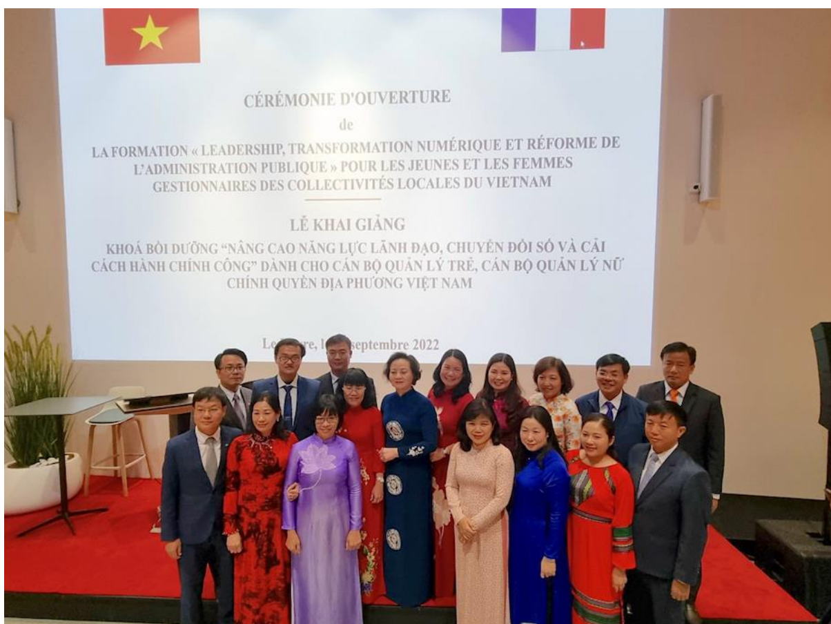
Bộ trưởng Bộ Nội vụ Phạm Thị Thanh Trà chụp ảnh lưu niệm cùng đoàn học viên khóa bồi dưỡng quốc tế dành cho cán bộ quản lý trẻ, cán bộ quản lý nữ chính quyền địa phương Việt Nam.