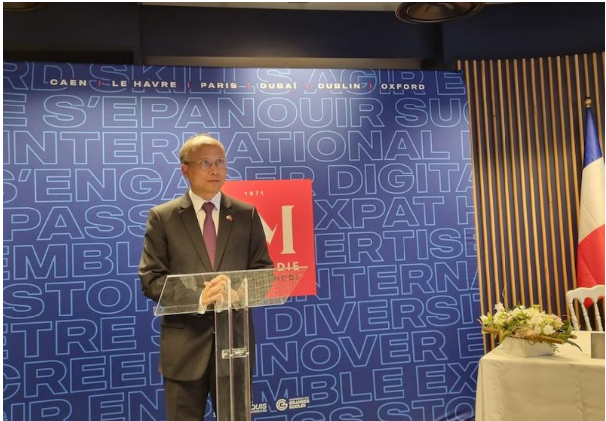
Đại sứ Đinh Toàn Thắng, Đại sứ Đặc mệnh Toàn quyền nước CHXHCN Việt Nam tại Cộng hòa Pháp phát biểu tại buổi làm việc và Lễ ký Thỏa thuận hợp tác.