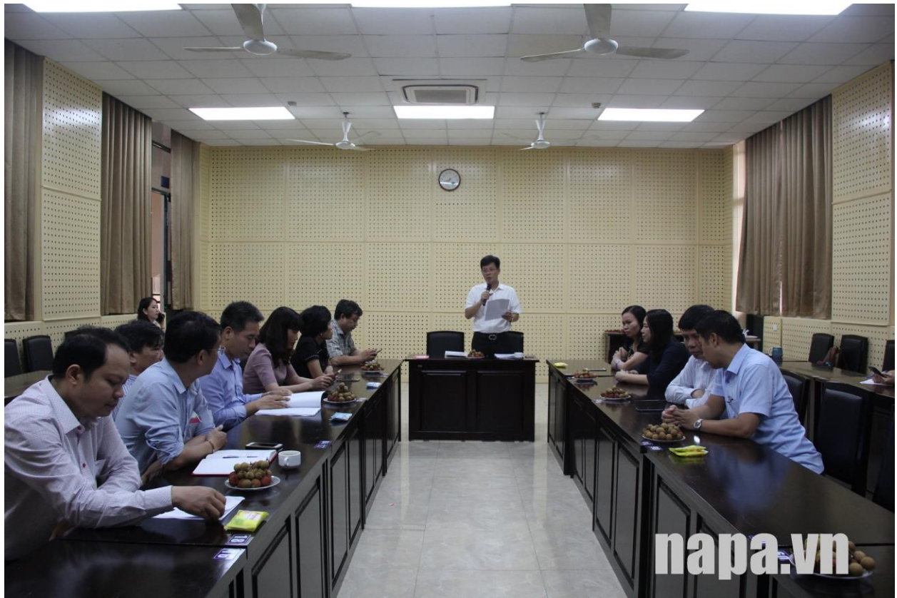
Toàn cảnh Hội thảo.