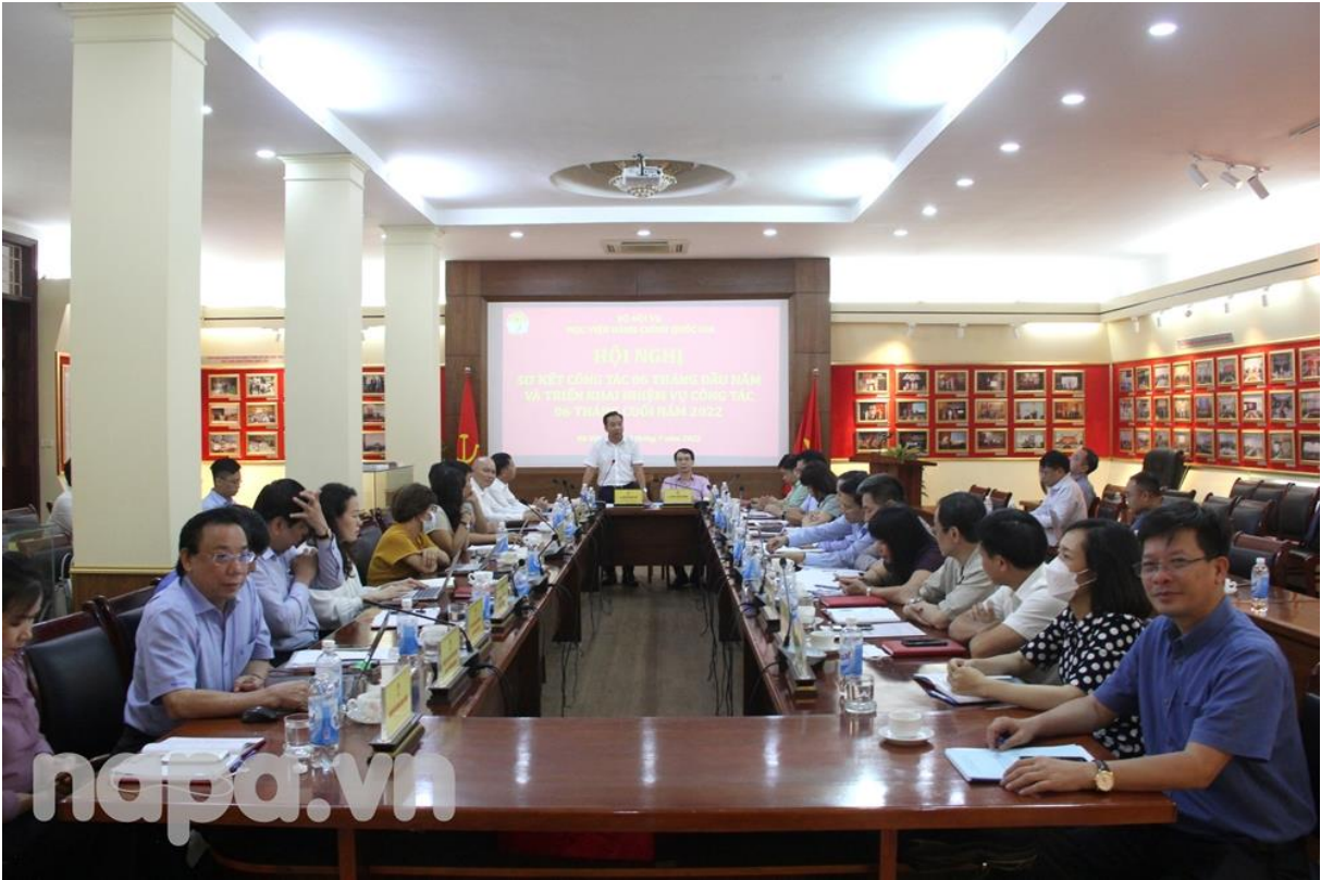
Toàn cảnh Hội nghị tại điểm cầu Hà Nội.