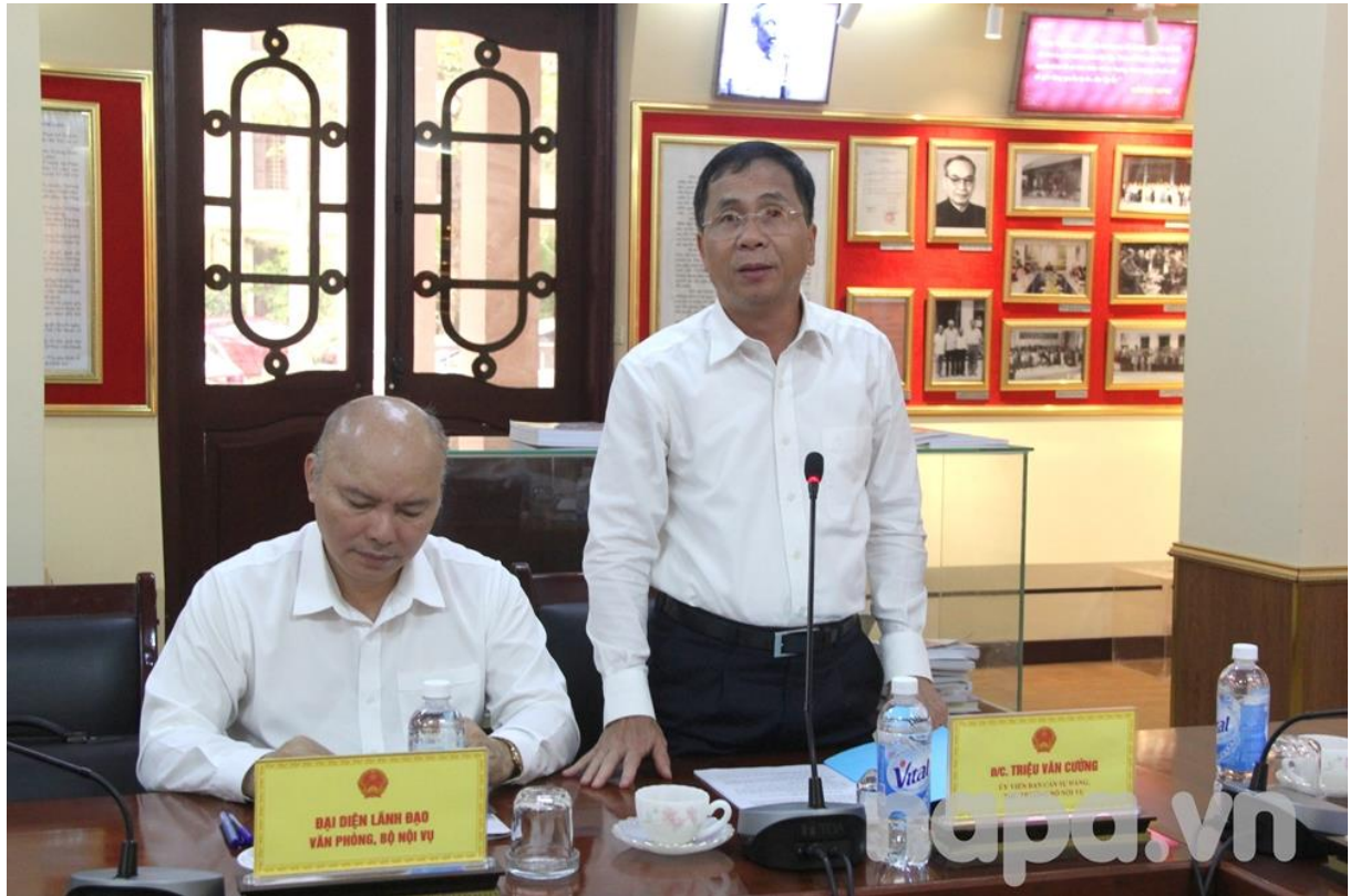
Thủ tướng Bộ Nội vụ Triệu Văn Cường phát biểu chỉ đạo tại Hội nghị.