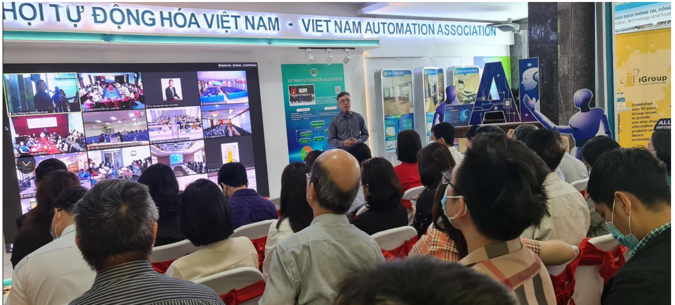
Điểm cầu Cục Thông tin KH&CN quốc gia

Cũng tại Triển lãm Sách đã diễn ra Hội thảo “Kỹ năng lựa chọn và đăng bài trên các tạp chí quốc tế uy tín” với sự tham gia của hơn 750 đại biểu tại Cục Thông tin KH&CN quốc gia và các điểm cầu Đại học Quốc gia TP. Hồ Chí Minh, Đại học Quốc gia Hà Nội, Đại học Cần Thơ, Đại học Thái Nguyên, Đại học Huế, Đại học Đà Nẵng.