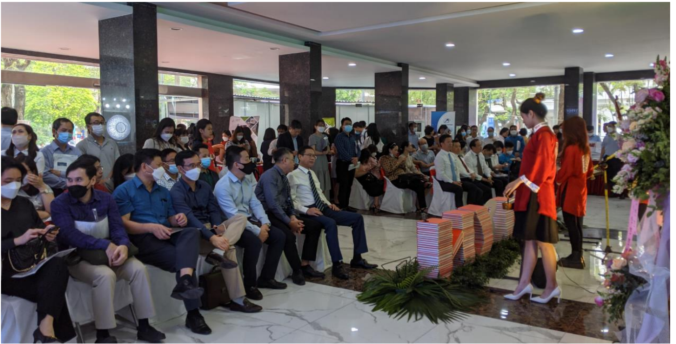
Các đại biểu tham dự buổi lễ khai mạc triển lãm