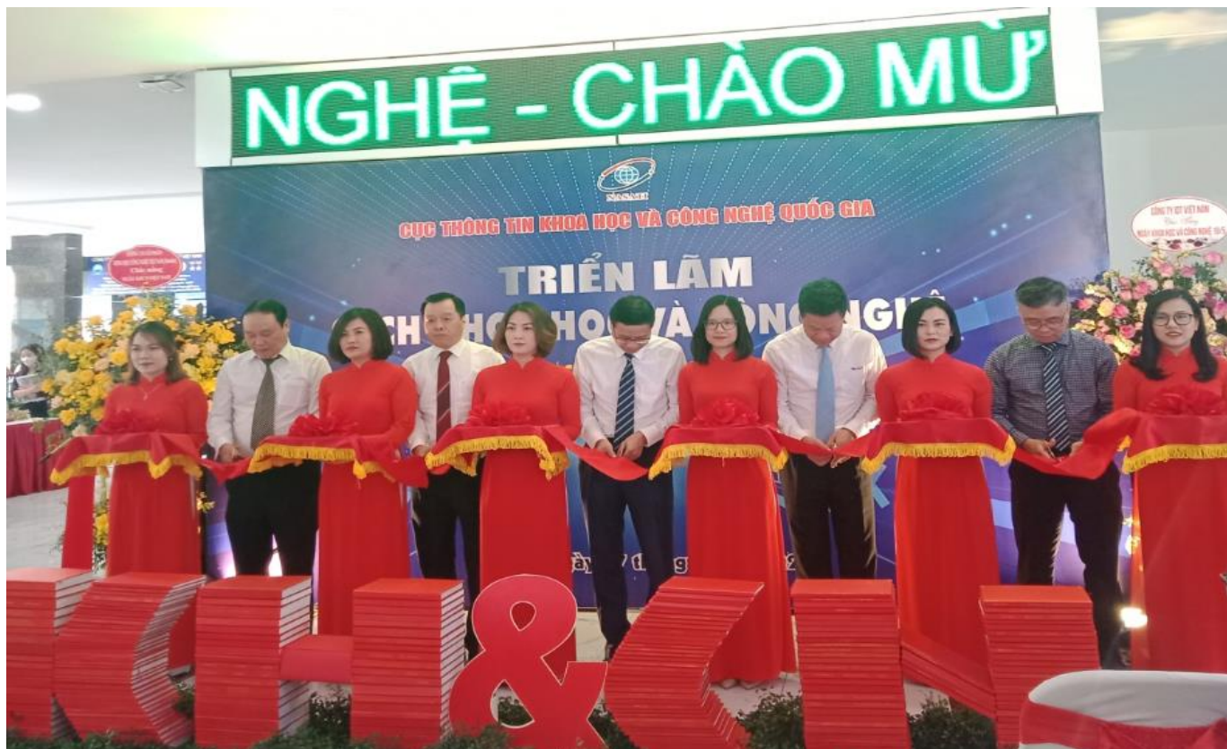
Lễ cắt băng khai mạc buổi triển lãm

Triển lãm trưng bày khoảng 2.000 cuốn sách, tạp chí và báo cáo kết quả nghiên cứu khoa học chia thành các lĩnh vực: khoa học tự nhiên; khoa học kỹ thuật và công nghệ; khoa học y, dược; khoa học nông nghiệp; khoa học xã hội và khoa học nhân văn.