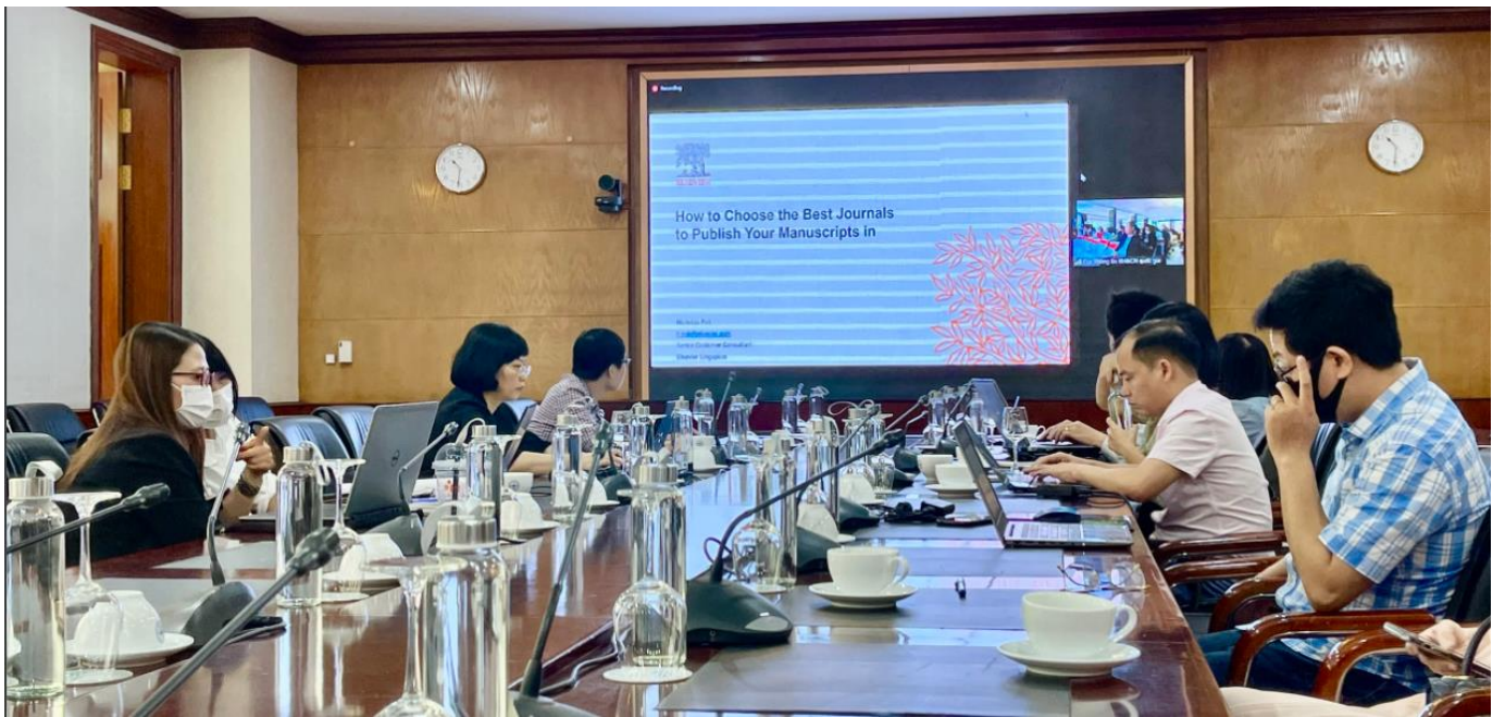
Điểm cầu Đại học Quốc gia Hà Nội