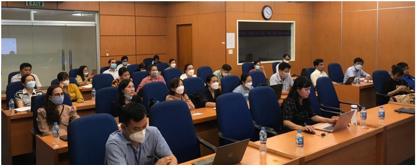
Điểm cầu Đại học An Giang

Triển lãm sẽ tiếp tục đón khách tham quan đến ngày 21/5/2022 tại số 24 Lý Thường Kiệt, Hà Nội, kỳ vọng tiếp tục thu hút được sự quan tâm của các chuyên gia, nhà khoa học, giảng viên, sinh viên cùng đông đảo công chúng tới tham quan. Tại đây, Ban Tổ chức cũng trao tặng quyền truy cập miễn phí các CSDL KH&CN quốc gia và quốc tế của Cục Thông tin KH&CN quốc gia tới công chúng yêu khoa học.